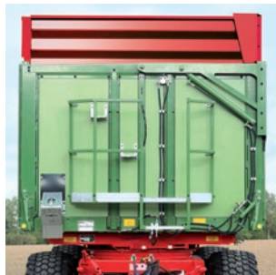
Silageaufsätze wahlweise in grün oder rot erhältlich