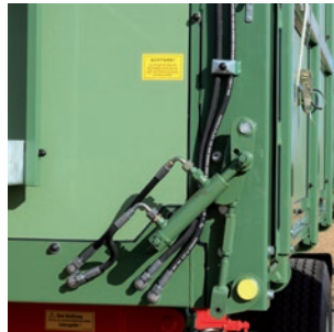
Hydraulisch öffnende Bordwandentriegelung