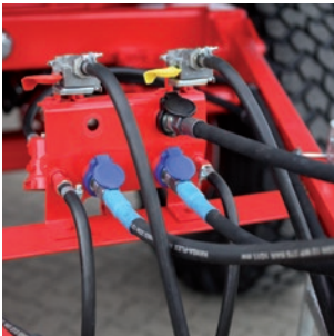
Zentrale Aufnahme für Hydraulik- und Druckluftanschlüsse