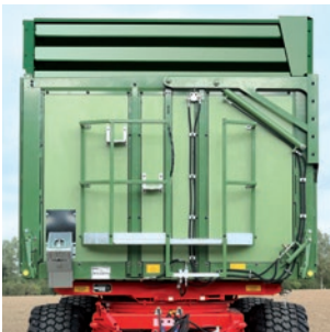
Vorderfront mit Podest und 500-mm-Silageaufsatz