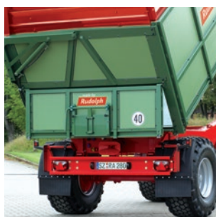
Geteilte Rückwand mit Auslaufschieber